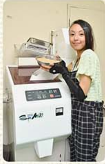
店内の精米機で、精米したてのお米はいかが?八戸産のつがるロマン、まっくらを玄米のまま購入し、その場で精米できる。1kg単位の少量でも購入出来るから、一人暮らしの方に嬉しい。

そして、何ととっても思い立ったらすぐに行けるという、アクセスの良さが◎。同店なら、「忙しくて、なかなか遠方の産直まで行く時間がない」という方だって、気軽に利用できるますね。ちょっとした時間ができたら同店でお買い物をして、帰りには6月から発売している、美味しいソフクリームも買っちゃいましょ!