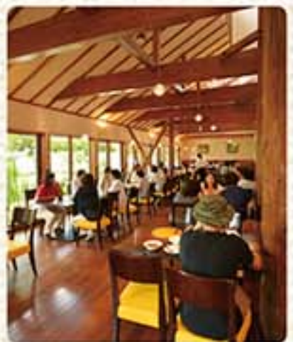
杉の生木を使った開放的な店内。

総 合観光農園「アグリ・の里おいらせ」の中にある「農園レストラン 百果良彩(ひやっかりょうさい)」は、同施設の産直で扱う地元野菜中心のお料理を、ビュッフェスタイル(食べ放題)でいただけます。普段お家でなかなか作らないようなアレンジメニューや、素材の味を引き立たせる味付けが評判で、週末には行列になるほど。時間に余裕のある方には、青森の郷土料理が曜日限定メニューとして食べられる、水曜日がおススメです。イチオシは、作付けから加工、販売と普及を進めている、青森県産もち小麦「もち姫」を使ったリゾットやピザ。ツ