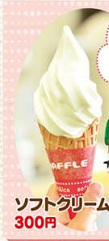
ソフトクリーム 300円

濃厚なミルクの風味なのに、後味がさっぱりでしつこくないうえ、現地より低価格で食べられるなんて…プールの予感♪