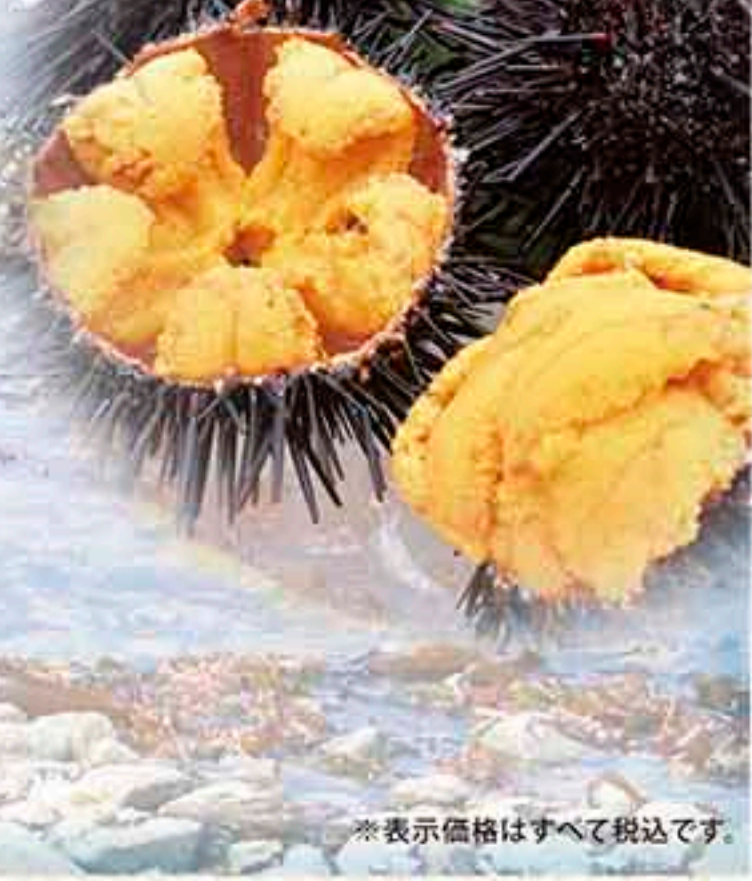
※表示価格はすべて税込です。

これから夏にかけて旬を迎える、八戸前浜のうに。とろけるように滑らかで、クリーミーな食感の生うには、そのまま食べるのもいいですが、井に仕立てるとその味わいは格別。ご飯との相性が抜群で、美味しさが最大限に引き出されます。今回は、鮮度にこだわった地物の生うに井を味わえる、とっておきのお店3軒をご紹介します。海岸線ドライブがてら、賢沢に食べ比べというのはいかがですか?