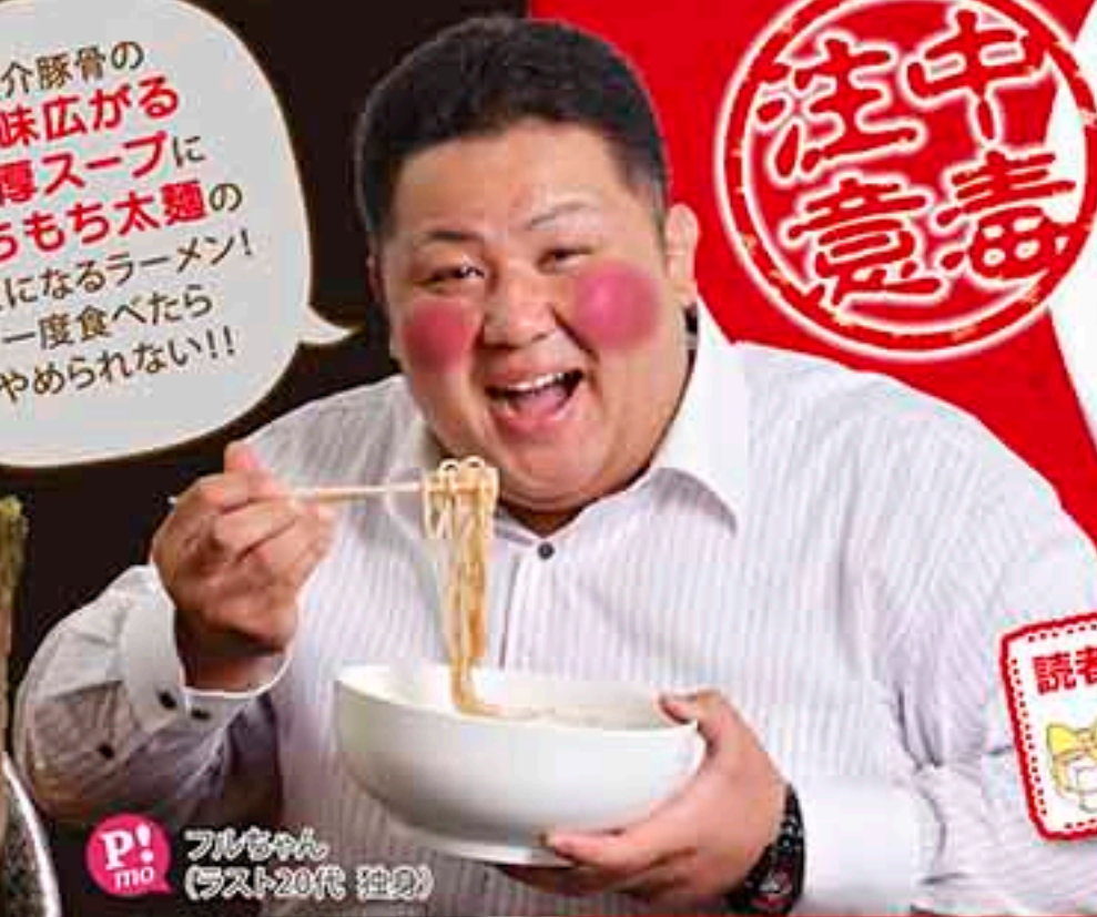
P!mo フルちゃん (ラスト20代 22)

魚介豚骨の旨味広がる濃厚スープにもちもち太麺のクセになるラーメン! 一度食べたらやめられない!!