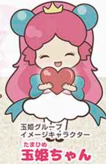
玉姫グループ イメージキャラクター たまひめ 玉姫ちゃん

忌中と喪中の違いは、近親者が亡くなったとき、喪に服す期間。一定の間自宅にこもって身を慎むことを「忌服」と言います。この「忌服」の期間を「忌中」と「喪中」と言います。今回は、忌中・喪中の正月の過ごし方をご紹介します。