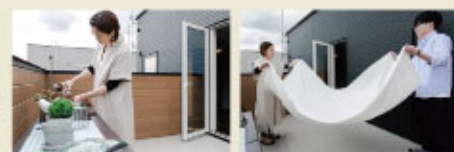
※写真は当社施工例

太陽光パネルが標準装備だから毎日の光熱費を抑え、住んでからの家計の負担も軽減できる。そんなゆとりある暮らしができるお家が完成しました。「家づくりって何から始めればいいのか...」そんなお悩みもスッキリ解消できる見学会。ぜひこの機会にお気軽にお越しください!