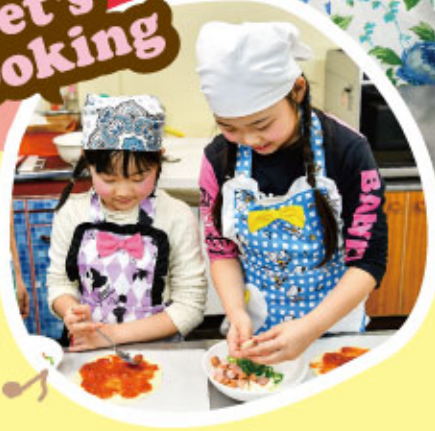
左から 恵美さん(30代 会社員)、まつりちゃん(小2)、ゆうりちゃん(小4) 取材・撮影協力/メラローサ

間もなくゴールデンウィークとなりますが、今年は新型コロナウイルス感染症拡大防止のため、お出掛けを自粛せざるを得ませんね。お子さんのいるご家庭では、例年以上にどのようにご過ごしただけか、頭を悩ませていませんか? この状況下で、プリュス編集部がオススメする今年のゴールデンウィークの過ごし方は、親子でクッキング。 ちょっとした材料をスーパーで購入するだけで、親子そろって楽しく美味しく過ごせますよ!こんな時だからこそ、お家でできるクッキングを通じて、食育そして親子のきずなを育んでみませんか?