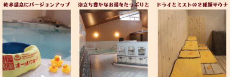
軟水温泉にバージョンアップ