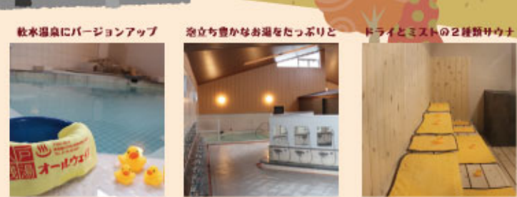
敷水温泉にバージョンアップ