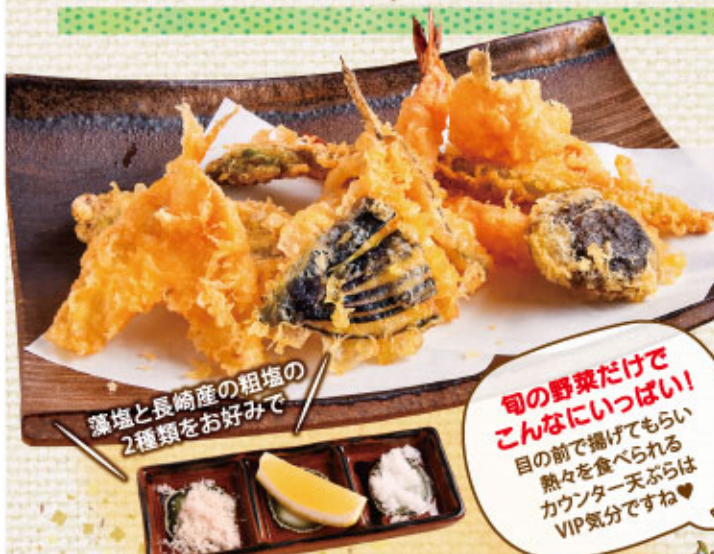
藻塩と長崎産の粗塩の2種類をお好みで

冷やし、余計な水分を抜く事で、伸びづらいうちに仕上げるひと手間を掛けています。また揚げ油は、江戸時代より続く伝統技法「玉締め絞り」製法の特注ごま油で、香ばしさやほのかな甘みなど、ごま本来の旨味を最大限に活かした最高級品。だから、たくさん食べても飽きたり、胃もたれすることがありません。 今や和食には欠かせない存在となっている天ぷら。シンプルながら料理だからこそ、熟練の職人技が光ります。ランチも人気ですが、地酒はもちろん和食に合うワインを豊富に取り揃えているので、夜が絶対オススメ！お酒を飲みながらカウンターでいただく天ぷらは、贅沢感とライブ感がたまりませんよ♡