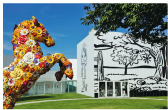
チェ・ジョンファ《フラワー・ホース》、奈良美智《夜露死苦ガール2012》、ポール・モリソン《オクリア》