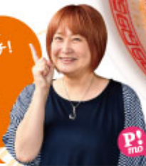
美々さん (50代 釣りレディ)

特注の中太ストレート麺に ほどよい辛さが絶妙にマッチ! 別注のご飯を 残ったスープに入れ ライスを楽しむのも オススメ♡