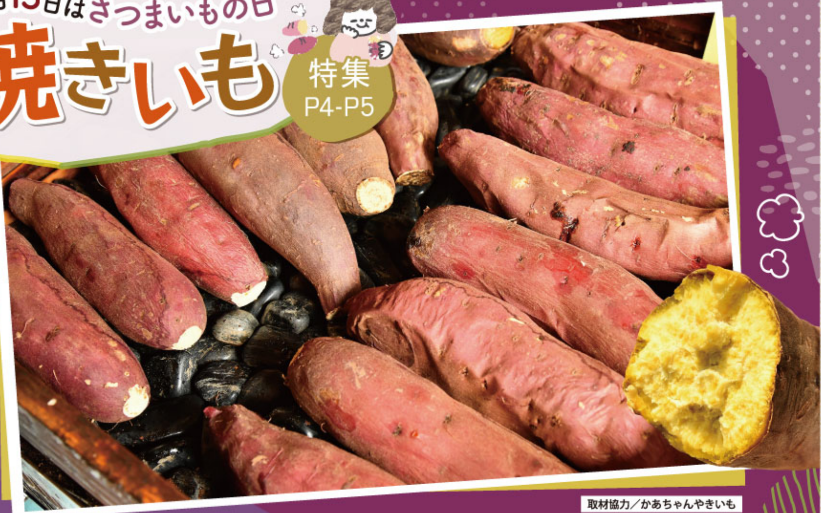
取材協力/かあちゃんやきいも

10月13日は「さつまいもの日」。江戸時代に「栗(九里)より(四里)うまい」というシャレから、さつまいもが「十三里(じゅうさんり)」と呼ばれたことにちなみ、ちょうどさつまいもが出回る時期として、「川越いも友の会」により1987年に制定された日です。さつまいもの主成分は炭水化物で、一見すると糖質が高そうですが、ご飯やパスタ、パンに比べれば、低GIで糖質が低め。また、便通を整える食物繊維はもちろん、肌に張りを与えるビタミンC、老化を防ぐビタミンE、高血圧の予防やむくみ解消に役立つカリウムなどが多く含まれ、細胞を傷つける活性酸素の働きを抑える抗酸化作用もあることから、美容やダイエットにも良いと近年注目されている食材です。さつまいもの美味しさをダイレクトに味わうなら、やはりシンプルな焼きいもが一番!今号のプリウスでは、朝晩寒くなってきたこの時期だから恋しくなる、焼きいもの美味しいお店をご紹介します。