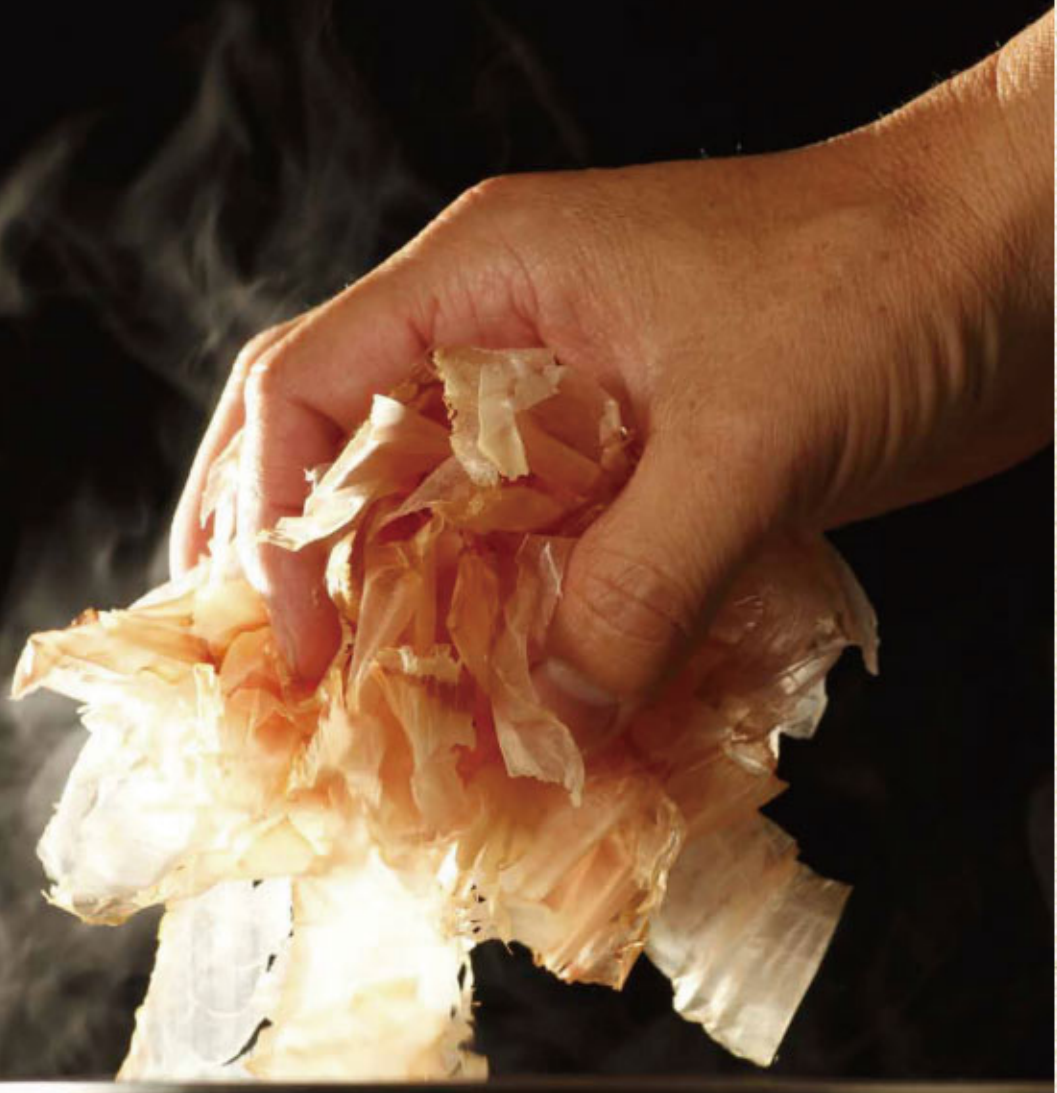
協力：有限会社静岡屋

11月20日は「いいかんぶつの日」、11月24日は「鯉節の日」にちなみ、今号のプリウスでは「だし」の魅力に迫ります。