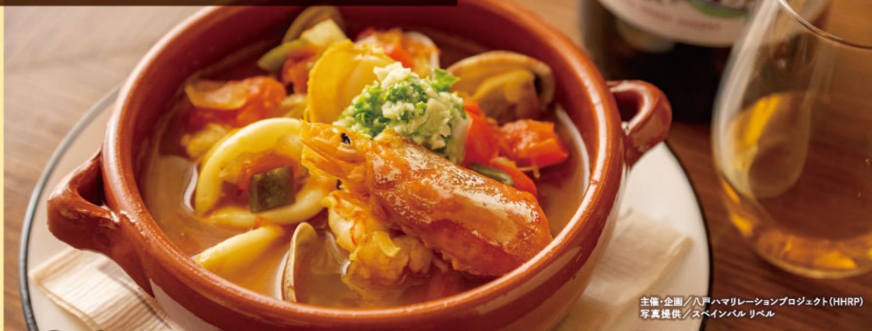
主催・企画/八戸ハマリレーションプロジェクト(HHRP)

八戸の魚介の美味しさがギュッと詰まった、冬の名物グルメ「八戸ブイヤベース」が味わえるフェスタは、2月1日スタートです!